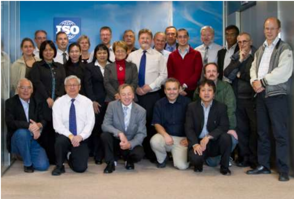
ISO CASCO WG 31 2012-07-21